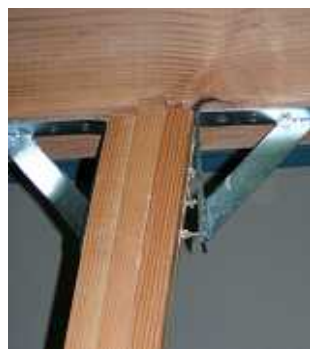
三角金物ビス抜け