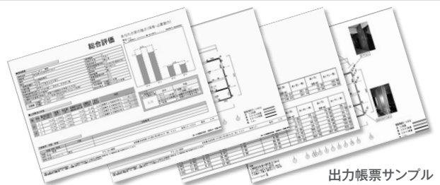
出力帳票サンプル

総合評価に加えて、寸法線入りの平面図などで見やすく、分かりやすい出力帳票。さらに写真やコメントを記載することができますので、お客様への提案も簡単です。